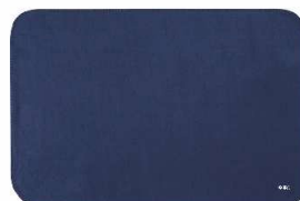
ベルト付き フリースブランケット 2色から選べます ●●