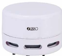
卓上ハンディ クリーナー (ノズル付き)