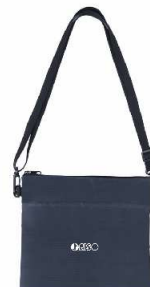
デイトフ・テントクロス ポケット付きサコッシュ (撥水加工)

※1社様につき一点となります。※数に限りがあるため、ご希望に添えない場合がございます。また、記念品の内容が変わる場合がございます。