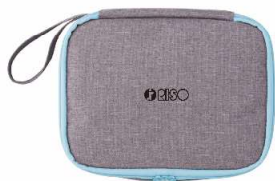
収納王子コジマジック・ マルチお薬ポーチ 2色から選べます ●●